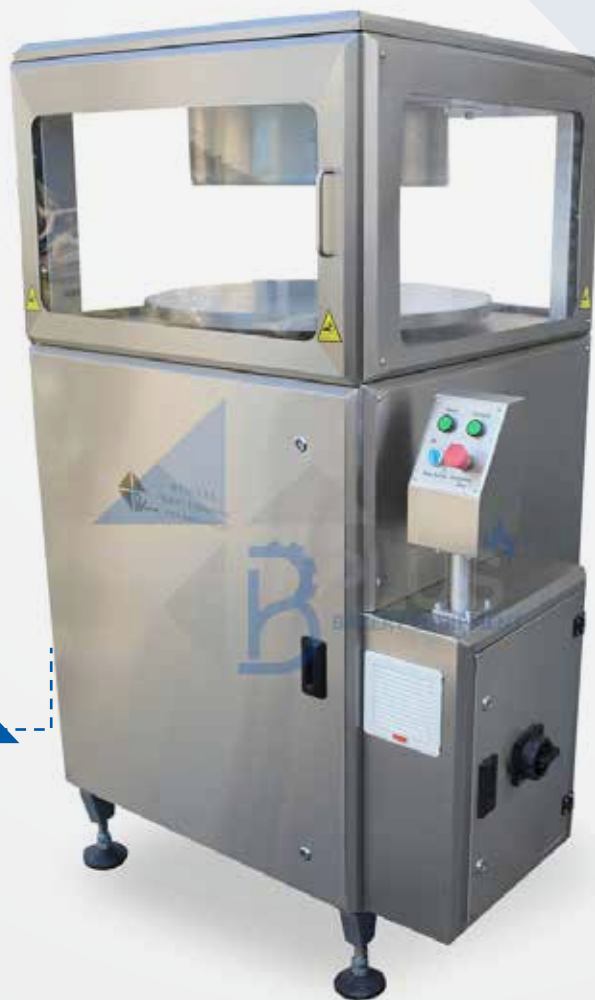
BREAD CUTTER MACHINE FOR MARKOUK ماكينة لتقطيع خبز المرقوق