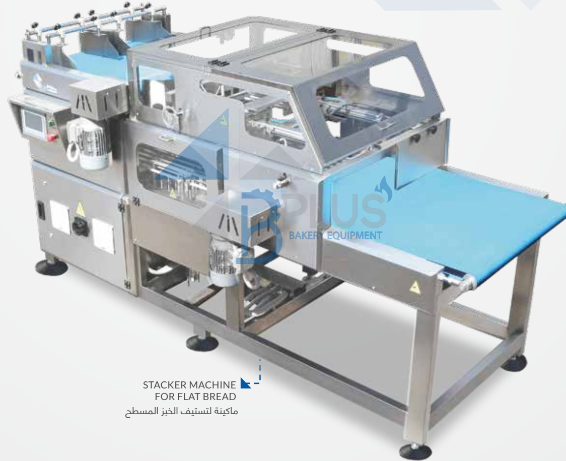
STACKER MACHINE FOR FLAT BREAD ماكينة لتستيف الخبز المسطح

The fully automated piece of equipment is highly reliable, convenient and user-friendly due to the HMI touchscreen displaying all sorts of operating parameters and settings, such as the number of units within a stack or the number of flipped-over loaves, as it is manufactured mainly according to client requirements and conditions imposed in each country.