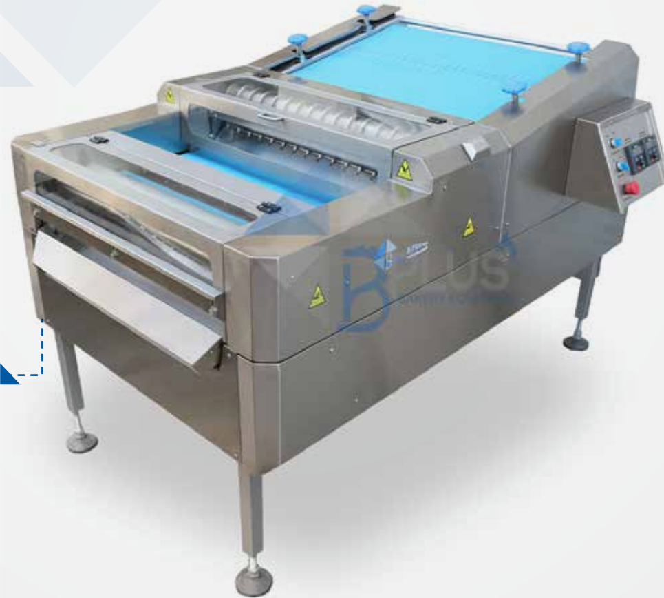
BREAD CUTTER MACHINE FOR PITA CHIPS ماكينة لتقطيع خبز البيتا

يقطع الخبز إلى أشكال مربعة أو مستطيلة على مرحلتين تقطيع من خلال قوالب قطع (حسب المقاسات المطلوبة الطول والعرض) عبر سيلندرات التقطيع الأفقية والعمودية.